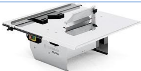
TS 230 I

Een lichte maar robuuste tegelzaag voor professioneel gebruik. De TS 230 F heeft een krachtige elektromotor en een uniek, gepatenteerd systeem voor het herwinnen van water tijdens lange werktijden.