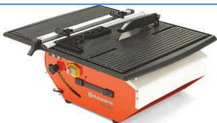
TS 230 F

Een lichte maar robuuste tegelzaag voor professioneel gebruik. De TS 230 F heeft een krachtige elektromotor en een uniek, gepatenteerd systeem voor het herwinnen van water tijdens lange werktijden.